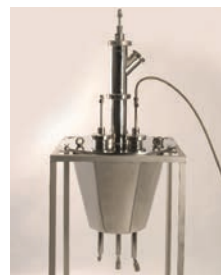
Boquillas de presión