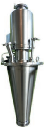
Atomizador rotativo de alta velocidad, diseño sanitario

La atomización es proporcionada por ruedas centrífugas, atomizadores rotativos, boquillas de presión o boquillas de doble fluido. Esta gama de sistemas permite cumplir con los requisitos específicos de tamaño de partícula para cada aplicación.