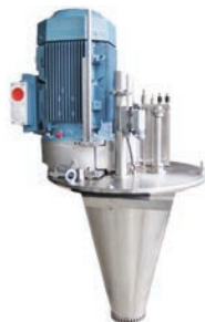
Atomizador rotativo con correa especial de alto rendimiento